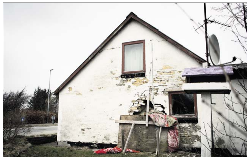
Faldefærdige huse hindrer udvikling på landet, og derfor skal der ryddes op, mener man i kommuneforeningen KL. Huset på Løkkensvej 777 i Hjørring har i årevis haft et stort hul i gavlen og er en af kandidaterne til nedrivning.

bygninger på landet er så faldefærdige, at de er dømt til nedrivning, vurderer Statens Byggeforskningsinstitut